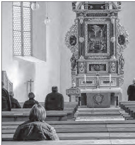
Čichopjatkowniša nutrnosť z wotstawkom w Michałskej cyrkwi

Budyšin. Čichopjatkowniše serbske kemše w Michałskej cyrkwi dyrbjachu lětsa koronakrizy dla wupadnyć. Přiwšěm bě cyrkej k wosobinskej modlitwje wotewrjena. Z někotrymi wosadnymi, kiž běchu so wotpowědnje předpisam z wotstawkom po cyrkwi rozsydali, swjećeše Serbski superintendent nutrnosť.