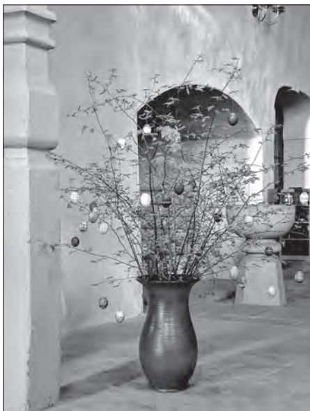
Jutrowny kwěcel w Rakečanskej cyrkwi

Rakečanska wosada měješe potrzebu na jejkach. Jutry rano pyšachu sobudžětaćerjo wosady cyrkej z kwěcelom ze zelených hažkow. Na kwěcelu dyrbjachu po móžnosći originalne serbske jutrowne jejka wisać. Zo by dosć jejkow było, su pilne