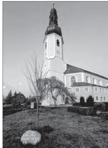
Jutrowničku rano w Bukecach, přědku Lutherowa lipa z přislušnym pomjatnym kamjenjom