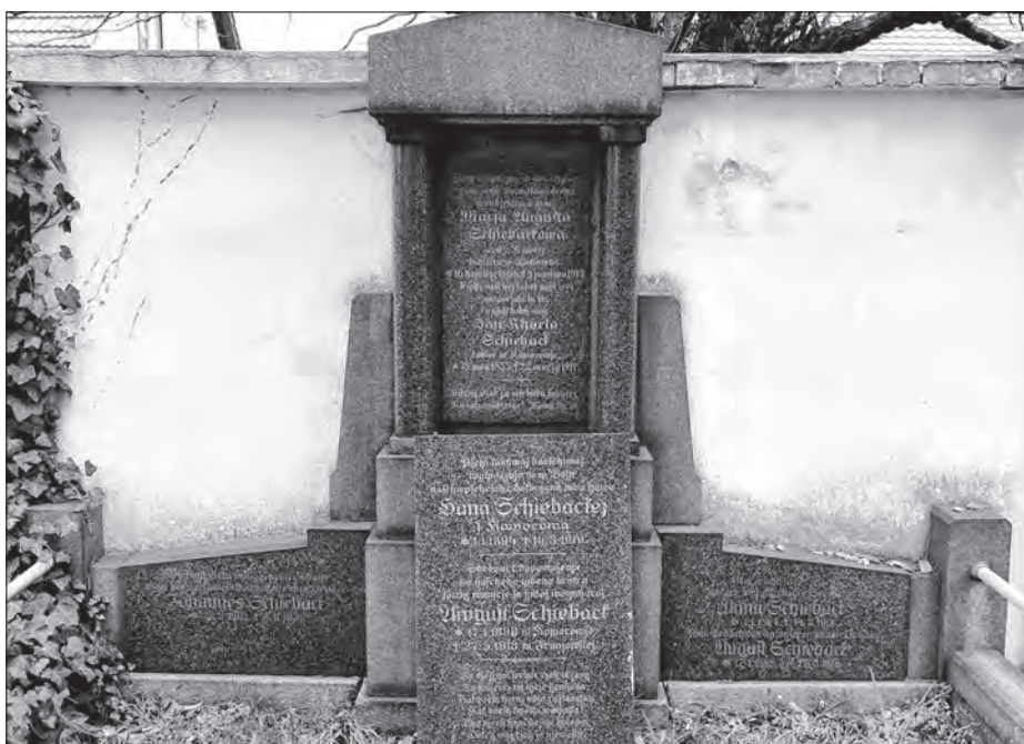
Row Šibakec swójby z Komorowa na starym Rakečanskim kěrchowje, předku na zemi stej nětka nawróćena serbska tafla