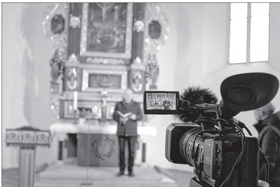
W nětčišej koronakrizje słuža technisce wobdarjeni wosadam z natočenjom digitalnych kemšow.