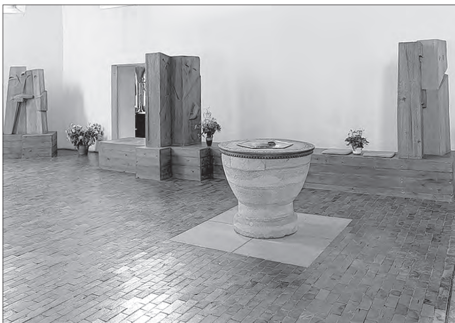
Wosom stow lět stara dupa w Hodźijskej cyrkwi