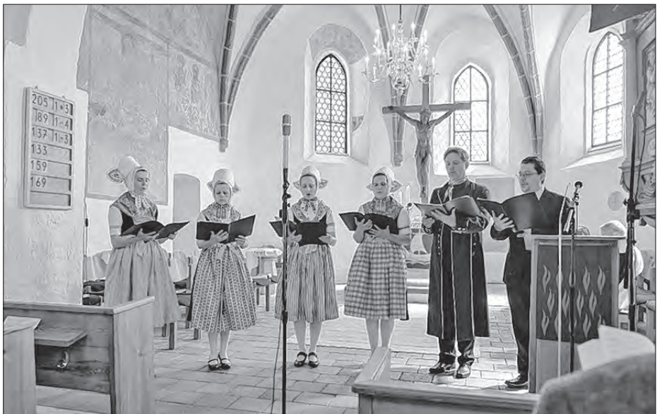
Spěwna skupina kólesko ze Slepoho Božu službu z kěrlušemi wobrubu.