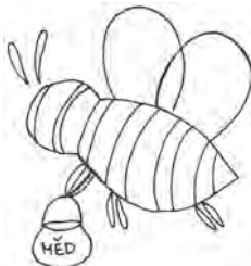
Rys.: M. Wirthec

Pčolki, pilne babki, nošće slódke kapki, nošće wjele mučki ze zahrody, łučki! Doma pjećće, warće, mudrje gospodarće! Wy so chwalić směće jeničke na swěće: „Měd sej hotujemy, wam tež darujemy.“