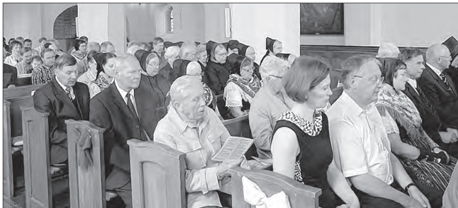
Kemšerjo we Wojerowskej Janskej cyrkwi (nalěwo) – Před Kulturnej fabriku zarejowachu sej wobdžělnicy półku (foto naprawo).