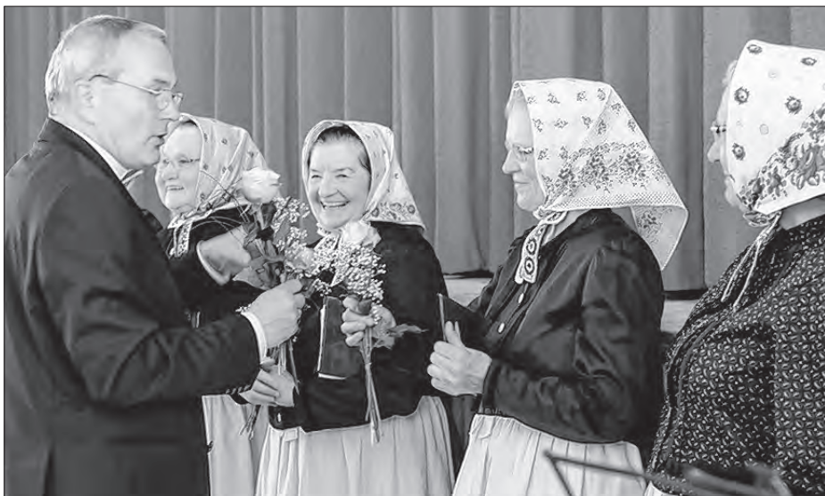
Serbski superintendent dźakowaše so spěwarkam Rowniskich glosow za spodobny program na žurli Slepjanskeho hosćenca.