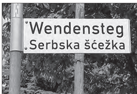
„Wendensteg – Serbska šćežka“ rěka dróha w Běłej Wodze.