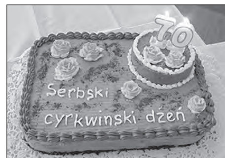
Wopytowarjow sobotnišeho zarjadowanja překwapi Slepjanska wosada z tortu.