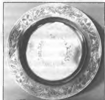
Taler ze serbskim napisom, darjony Křižnej cyrkwi w lěće 1900

Keluch a taler přětraštej hrózbnu nóc 13. februara 1945; njewobškodźenej namakaštej so w rozpadankach Křižnej cyrkwy. Džensa hišće wužiwaštej so při Božich wotkazanjach w Křižnej cyrkwi.