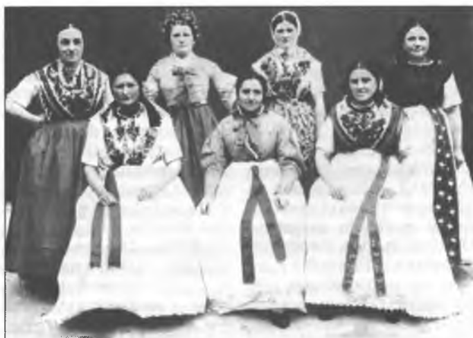
Čłonki towarstwa Čornobóh w Drježdžanach w dwa- cetych lětach

wědnik bě farar Jakub z Bu- dyšina. Kemše trajachu dlě- je hač tři hodžiny. Kěrluše spěwachu so ze zešiwka, kiž bě farar wosebiće čišćeć dał. Dwaj serbskej wučerjej, Pjekar z Budyšina a Höhna z Wulkeho Wjelkowa, hraje- štaj na piščelach. Boža slu- žba zbudži sylne začuća: „Z chwilemi njebě drje žane wóčko k wuhladanju, z