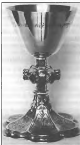
Keluch ze serbskim napisom, darjony Křižnej cyrkwi w lěće 1900

Hdyž so po třoch twarskich lětach znowaposwěćenje Křižnej cyrkwy bližeše, wobzamknjachu serbscy duchowni, přepodać wosebity dar w mjenje serbskich wosadow we Łužicy. Měješe to być trajna dopomnjenka na Serbow,