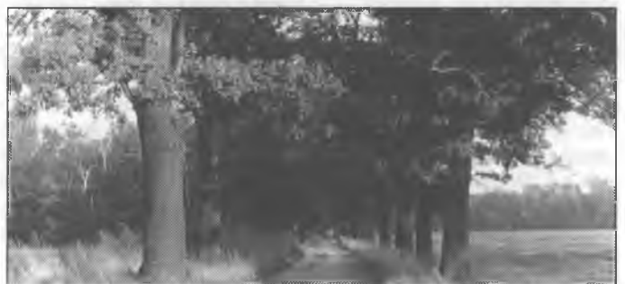
Puć pola Holešowa.