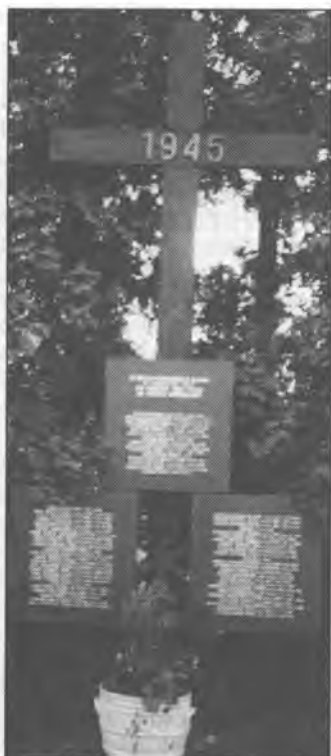
Rowy na ewangelskim kěrchowje w Klětnom (pódla). W tutym rownišću wotpočuje 91 němskich mrtwych z druheje swětoweje wójny; z nich wostachu 28 njeznatych. Mortwym k wopomnjenju – žiwym k napominanju!