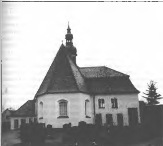
Ewangelska cyrkej w Klětnom