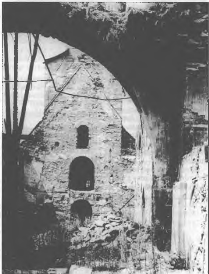
Njeswačidło w léce 1945

Tež w přichodže budže wážne, zo so přeco zaso dopominamy na tutón čas, zo so dopominamy, kajki wusutk zły duch ma, hdyž wón moc docpěje. Tež džensa to na swěće widžimy. Chcemy tež dale Boha prosyc, zo wón nas, naš kraj a cyły swět před dalšimi wójnami zwarnuje a zo bychu so wójny skončili, kotrež so tuchwilu hišće wjedu. H.W.