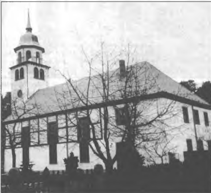
Cyrkej samostatneje ew.-luth. Janoweje wosady w Klětnom-Jamnom