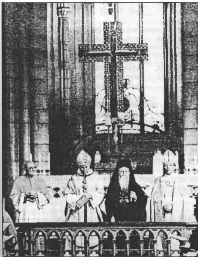
Cyrkej w Uppsali