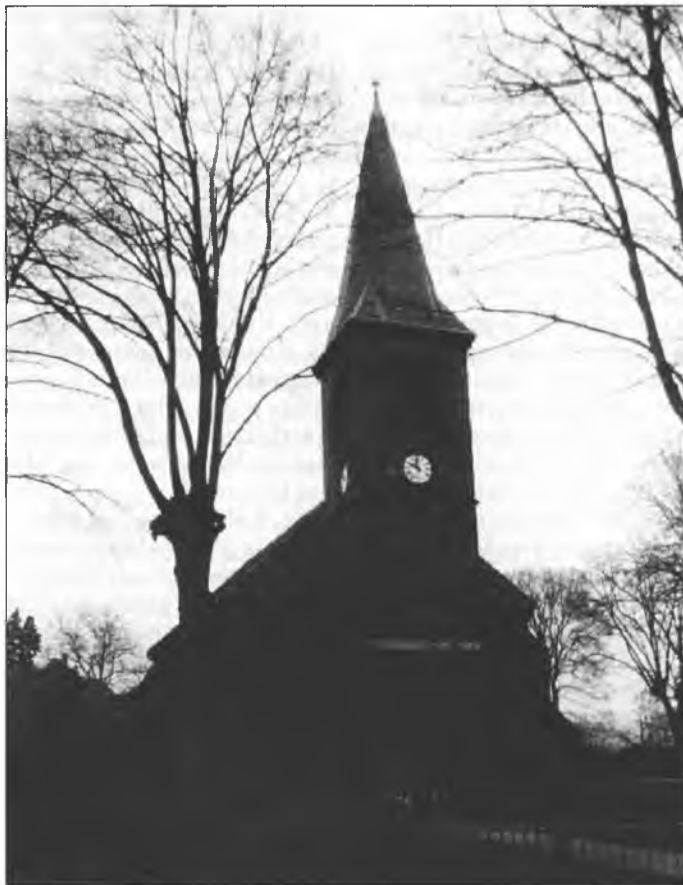
Cyrkej we Łupoji