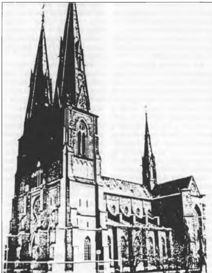
Cyrkej we Uppsali

Skandinawska je znata jako tón protestantski sewjer. Tole zwuraznja so samo na chorhojach pjeć skandinawiskich krajow, na kotrychž je križ widjeć. Reformacija a lutherska wěra hraještej tu kaž w Němskej wulku rólu w cyrkwiskim, politiskim a kulturnym žiwjenju. W lěće 1993 před 400 lětami přesadzi so reformacija w Šwedskej. W cyłym zańdženym lěće, dokładnje wot 1. adwenta 1992 do 1. adwenta 1993, potajkim w cyrkwiskim lěće, so tohodla swjećeše. Za to wuhotowachu so w každym biskopstwie samostatne swjedenjenje, a w awgusće wotmě so w Uppsali, w srjedźišću cyrkwiskeho žiwjenja a sydla arcybiskopa, hłowny jubilejny tydzień. Na tutej wjele zarjadowanjach wobdželi chu so mjezynarodni hosćo, mjez nimi zastupnicy ewangelskich cyrkwjow a tež druhich nabožinow. Swjedenje dyrbye tež na džens tak trěbnu ekumenu pokazać. Swjedenje kemše w Uppsalkej katedrali swjećachu dnja 22. awgusta tohodla zhradnjenje kardinala romsko-katol-