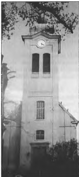
Pohlad na w léce 1748 natwarjenu cyrkwej we Wochozach