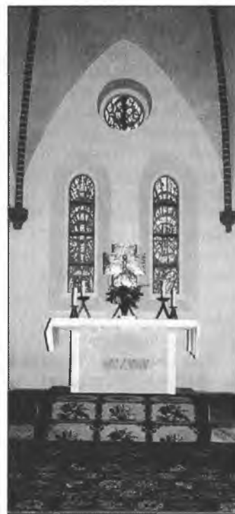
Cyrkej we Łupoji