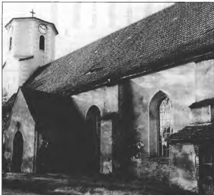
Cyrkej w Njeswaćidle

W Swjatym pismje namakamy wuprajenje, zo Bóh samlutki znaje wutrobu wšěch čłowjekow. Kak mamy to zrozumić? Je to snadź jenož tehdy wěro bylo, hdyž njebě čłowjeski duch hišće tak wysoko wuwity kaž džensa, tak zo njebychmy my na tajku mudrosć hižo pokazani byli? Lěkarjo a psychologjo wušuša nam poslednje hódančka našeje wutroby. Hdy by tak bylo, potom njebychmy hižo Boha trjebali a bychmy móhli Bože słowo nabok połožiť. Tola zdawna tomu tak njeje. Hižo na cyle jednore prašenje nam wědomosć hač dotal wotmołwy dała njeje: Je wutroba čłowjeka, to, štož jeho w najhlubšich nutrinach postajuje a wjedže, dobra abo skažena? Je čłowjek wot přirody sem dobry abo hubjeny? Wo sebi drje by kóždy prajił, zo je wón dobry, ze wšelakimi słaboscemi drje, ale w cyłku tola dobry. Pola druhich ludźi sej hižo tak wěsći njejsmy.