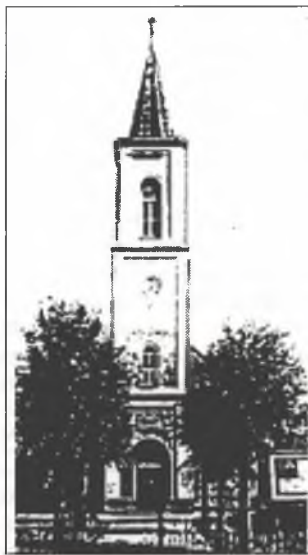
● Cyrkej Swjateje Trojicy we Wukrančicach (1846)

Narodna prócowarka a basnjerka Witkojc je kaž njewočakowany Boži dar wosrjedz struchleho časa. Bohužel pak jón wjele ludźi zańč nima, štož pak ničo na tym njezměni, zo jedna so wo hodnotny dar.