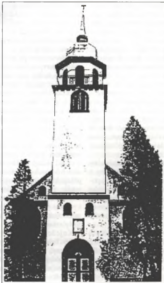
● Cyrkej Janskeje wosady w Klětnom, natwarjena 1847

Na 150lětny založenski jubilej spominašej starolutherskeje wosadze lětsa wot 24. apryla hač do 2. meje z bohatym swjedenkim tydzenjom. Wšědnje poskićowaše so bohaty program za džěčinu, młodostnych a dorosćenych. Wsrjedzišću nješteješe jenož zabawa a zhromadne swjedenje, ale tež kublanje we wěrje a zeznaće swójskich korjenjow.