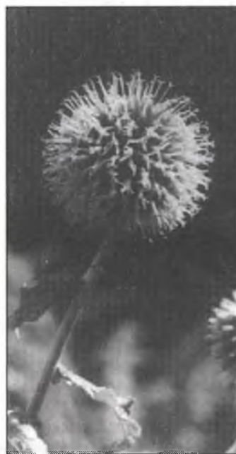
● Jenož jedyn móst