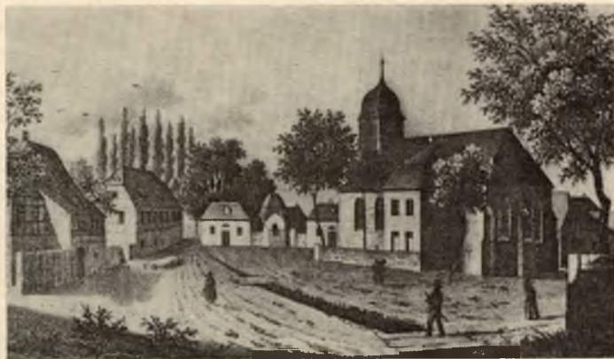
Malešecy wokoło 1840

W tutym zwisku njerěčimy wo wariantach duchowneho roscenja a žiwjenja, ale wo wobsahu we mjezach prawowěrnej křesćanskeje identity. Mi parsonse so jara lubi tamón klasiski wobraz, kiž móže wšěm služić za spomóžne wobrubjenje a zawěšćenje a jako samoprutowanje, hač smy woprawdže rostli abo w roscenju, kotrež so wot nas wočakuje. To plaći za nas, móžemy-li zapřijeć, kotra je šerokosć a dołhosć a wysokosć a hlubokosć. Feustel