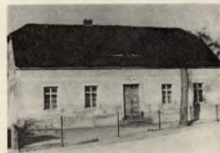
Ródny dom Bjarnata Krawca w Jitru