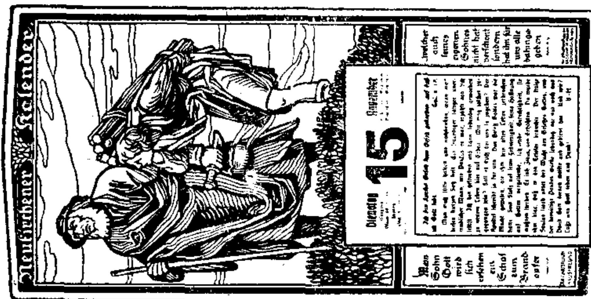
Pschedawta: Esmolerjež kniħicžiščezēnja a kniħatnja, š. dr. š w. r. w Budyščinje.

Sa žmjerťnu njedzele. So je našche wožebite čžizlo, kotrež smy pošlednje lēta kōždu žmjerťnu njedzele wudali, wožadamy a wožadnym jara witane, widžimy i teho, so žu lēťka hižo šta čžizlow škašane, hacž runje njebečmy ničžo hiščcže wošjewili. To je šwježelaze, a my žebi myšlimy, so budžeja runje lēťka šararjo a wožady rad na žmjerťnej njedzele wožebite listno rošdželicž čžyncž. Že džē tola žyťy čžaj tať cžežki a kħutny, a wokoło žmjerťneje njedzele budžemy to čžim bōle šacžuwacž. Tuž tohodla dženzka wošjewjamy, so sa žmjerťnu njedzele našche kopjeňko „Pomhaj Bōh“ šažo 8 štron wulke a wožebje wuhotowane wudamy. Tohodla prošymy, so bychu wšchitžy tuto čžizlo bōřny škašali a to najpošdžišcho hacž do pōndžele, 16. novembra w Esmolerjež čžiščezēni. Prošymy wšchē wožady, so bychu tež tuto čžizlo do wšchých domow rošdawake abo na kēřchowje wšchēm kēmšerjam. To čžini jich hižo mnoho wožadow lēta doľho je pschipōšnacžom wožadnym a se žohnowanjom. Wožebite žłowo žłušcha wokoło žmjerťneje njedzele do kōždeho doma a lēťka wožebje. A čžehodla njedyrbjaťo tuto žłowo žerbške bnyč? — Tuž prošymy, so byščcže bjes komdženja škašali. Esmolerjež kniħicžiščezēnja. Redakcija.